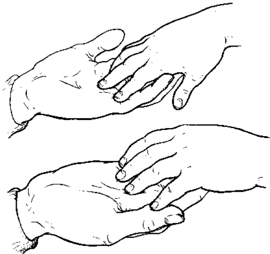
Bild 2: Die Hände des Lehrers liegen unten - bereit für das Kind, sie als Werkzeug zu benutzen.