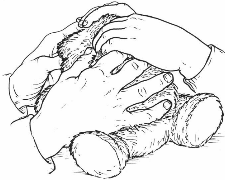
Figur 1. Underviserens hænder er placeret ganske let under barnets, mens de udforsker sammen