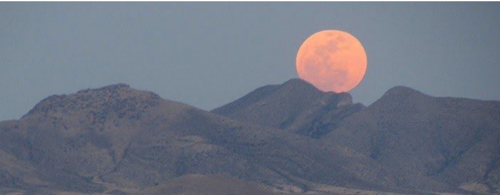
Imagen: Una “super luna” rosa sale sobre la cima de la montañas